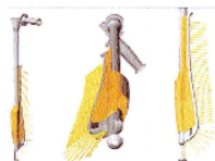
Darsteller im neuen Bühnen-Programm: Klebstoffe, Tankanlage und Schrauben